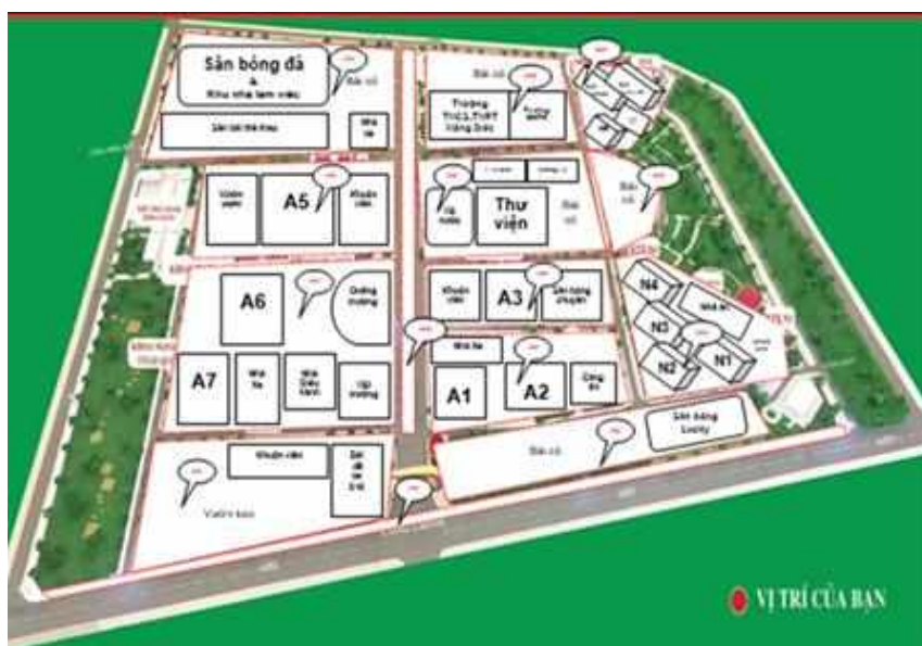
Hình 3: Sơ đồ phân khu số hóa cây xanh – trường Đại học Hồng Đức

Đối tượng nghiên cứu của đề tài là hệ thống cây xanh trong khuôn viên Trường Đại học Hồng Đức, tọa lạc tại thành phố Thanh Hóa, với diện tích 47,8 ha, trong đó cơ sở chính 38,4 ha. Hệ thống cây xanh bao gồm hơn 2.000 cây thuộc nhiều loài khác nhau xà cừ, vối, đa, cau vua, bằng lăng, sao đen, lộc vừng, giáng hương, ngọc lan, phượng, xoài, vải,... Các cây được phân bố chủ yếu dọc theo các tuyến đường nội bộ, khu vực sân trường, công viên nhỏ, và không gian quanh các tòa nhà chức năng.