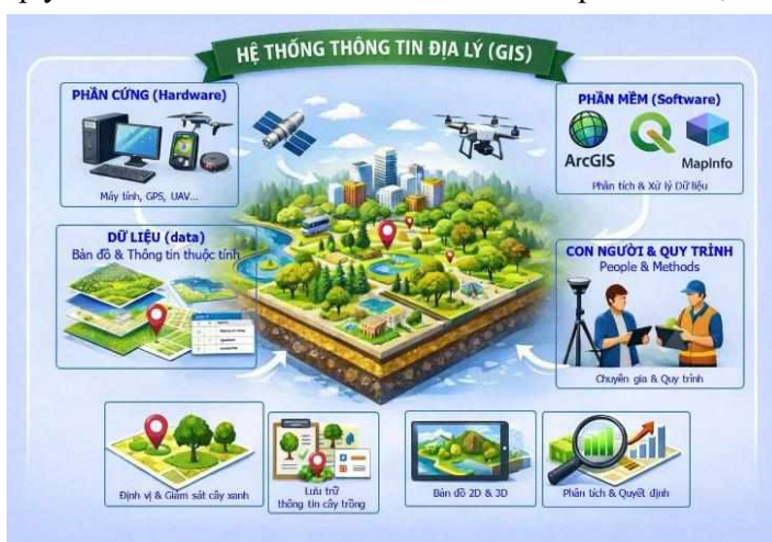
Hình 1. Sơ đồ kiến trúc tổng thể của hệ thống GIS

GIS cho phép liên kết dữ liệu không gian với thông tin thuộc tính, giúp mỗi đối tượng trên bản đồ đi kèm các thông tin mô tả chi tiết. Trong quản lý cây xanh, GIS hỗ trợ định vị cây bằng tọa độ GPS, lưu trữ các thông tin như loài, kích thước, tình trạng sinh trưởng và lịch sử chăm sóc, đồng thời trực quan hóa dữ liệu trên bản đồ số hoặc bản đồ 3D. Nhờ đó, người quản lý có thể dễ dàng quan sát mật độ cây, phân tích dữ liệu và đưa ra quyết định về quy hoạch trồng mới, tính toán tỷ lệ che phủ hoặc lập kế hoạch bảo trì.